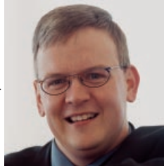
Jens Eckhoff Senator für Bau, Umwelt und Verkehr

Ich wünsche mir, dass die Newsletter, als ein erfolgreiches Kommunikationsmittel für und über die 'partnerschaft umwelt unternehmen', auf eine breite und positive Resonanz treffen werden.